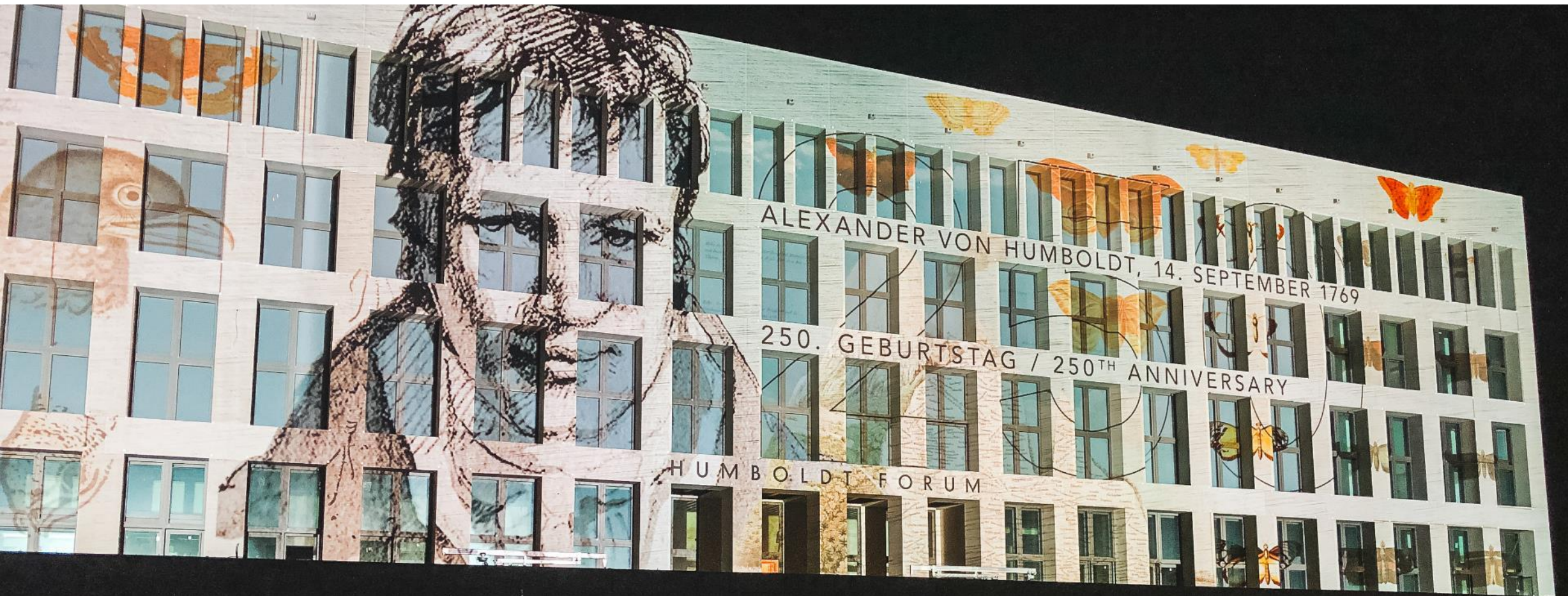
Fassadenprojektion auf das Humboldt Forum, Berlin