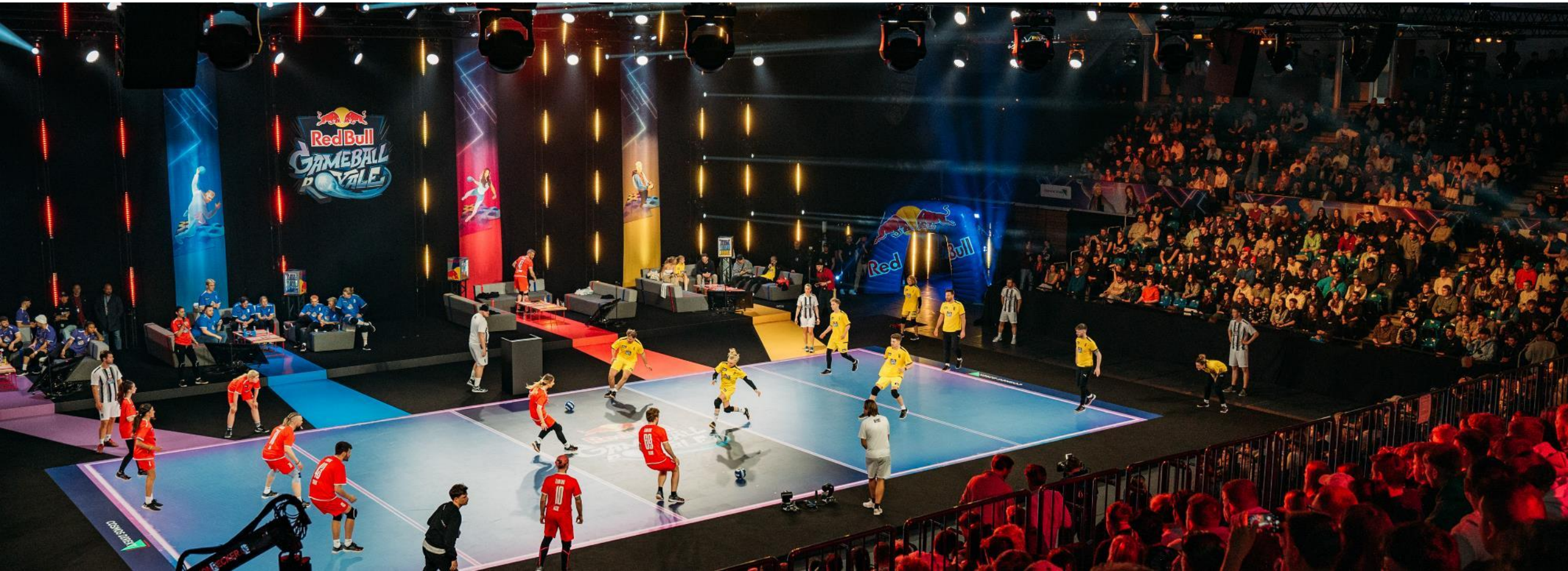
Red Bull Gameball Royale, Hamburg